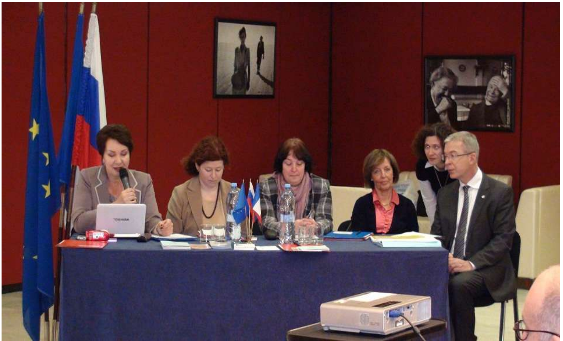
Школа профилактики ФАСН. г. Москва, ФГБУ ЦНИИОИЗ, Ассоциация Врачи Мира (Франция) при поддержке Посольства Франции, 23-24 января 2012 г.