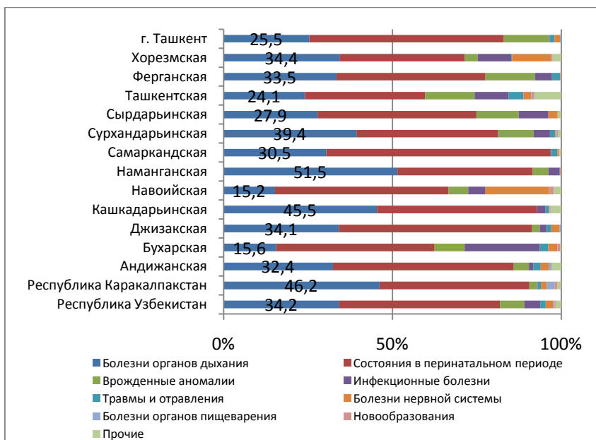
Рис. 2. Структура причин младенческой смертности в 2012 г., %

В Наманганской области, судя по официальным данным, половина детей умерла до года вследствие болезней органов дыхания, тогда как в Ташкенте – 25,5%. И это при более высоких общих показателях. При этом в Наманганской области на врожденные аномалии пришлось 4,6% умерших, тогда как в Ташкенте -13,4% (рис. 2). Возможно, что имеет значение качество диагностики причин смерти, однако только этим фактором нельзя объяснить многократные расхождения.