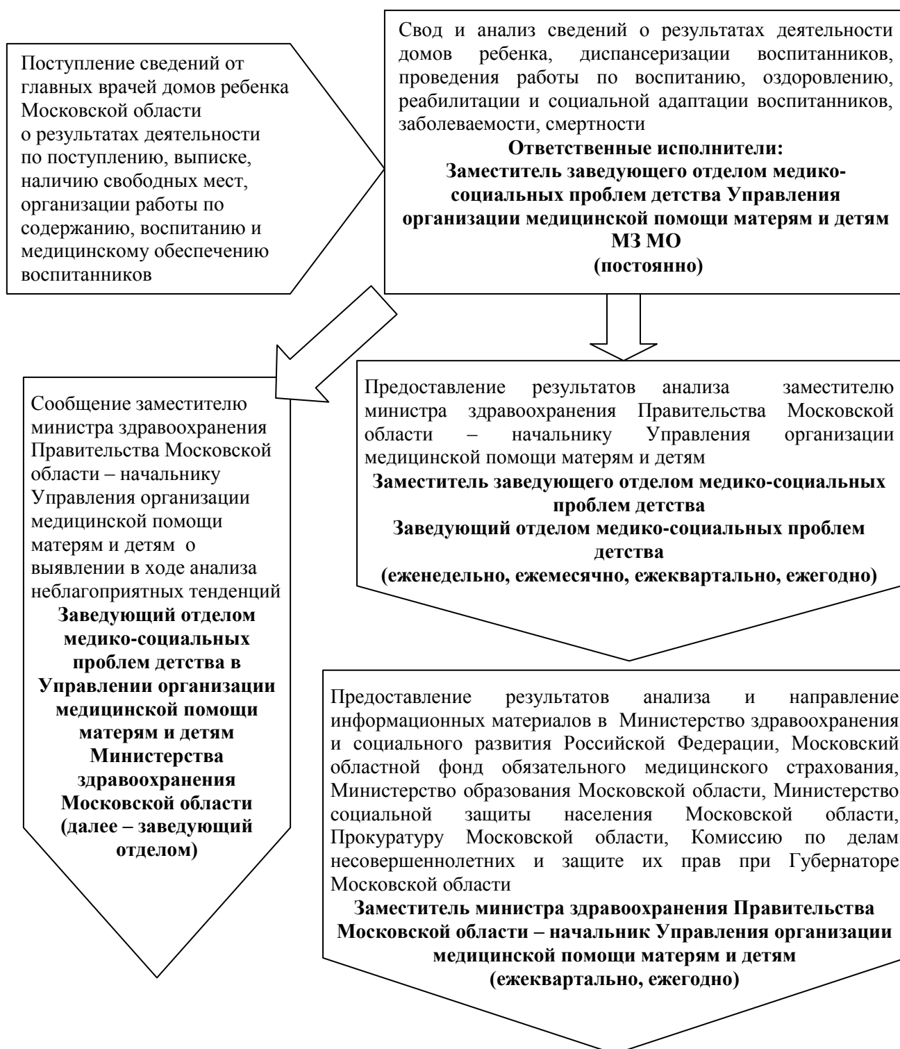
Схема: «Получение и анализ сведений о результатах деятельности по организации работы по содержанию и медицинскому обслуживанию детей в домах ребенка Московской области»

к административному регламенту исполнения Министерством здравоохранения Московской области государственной функции организации работы по содержанию и медицинскому обслуживанию детей в домах ребенка Московской области