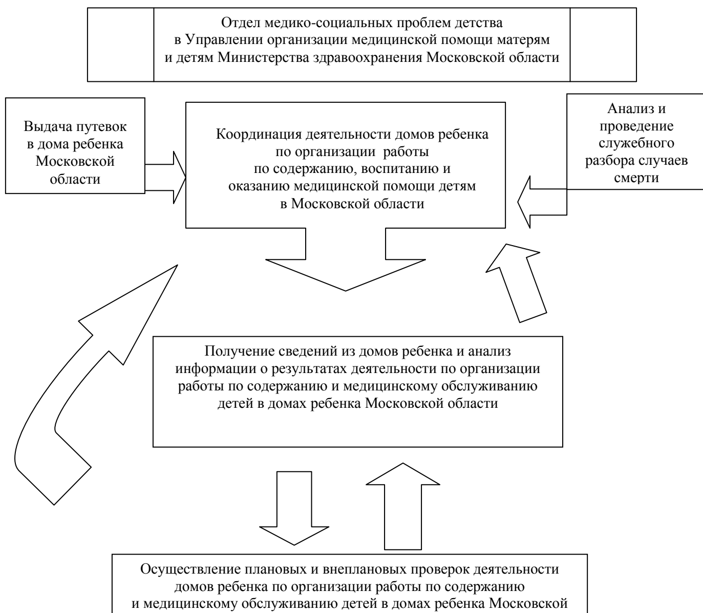
Схема: «Структура и взаимосвязи административных процедур, выполняемых при исполнении Министерством здравоохранения Московской области государственной функции организации работы по содержанию и медицинскому обслуживанию детей в домах ребенка Московской области»

к административному регламенту исполнения Министерством здравоохранения Московской области государственной функции организации работы по содержанию и медицинскому обслуживанию детей в домах ребенка Московской области